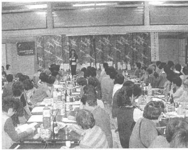
第7回東日本女性登山交流集 (長野県大田市)

第7回東日本女性登山交流集が長野県大田市で開催された。東日本の15地方連盟から49団体208人、西日本からも4地方連盟12人が参加。主催は