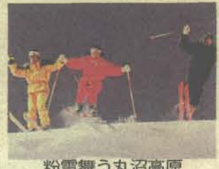
粉雪舞う丸沼高原

置するあたたら高原スキー場は、東北道二本松ICから20分。ゴンドラと4本のリフト。☆今シーズン歩くスキーコースオープン。レンタルスキーも完備。労山会員カードで10%割引。 20243-24-2 (長野県・北八ヶ岳) 246。青苔荘 (長野県・北八ヶ岳) ☆忘年会(12/31)、新年会(1/1)どちらも飲み放題1泊2食で1万円。☆スノーシュートレッキング、バックカントリースキーとテレマークターンプリ講習会を実施。事前予約者は送迎。労山会員カードで10%割引。 2090-1423-1 (新潟県・妙高) 2725。田端屋 (新潟県・妙高) 毎月第3土曜日は、かんすり汁を特別提供。事前予約でかんすり鍋(一人前600円)を毎日提供。毎月イベントを計画しています。 20255-86-6 (群馬県・奥日光) 108。ペンション リーシェントハウス (群馬県・奥日光) 丸沼高原スキー場まで徒歩3分。スキー学校、スノーボードスクールあり。ファミリーから上級まで13コース。食事は、洋食フルコース。家庭大の同宿も可。 労山会員カードで休前日・年末年始10%割引、平日は20%割引。 20278-58-2 (東京都・御岳山)