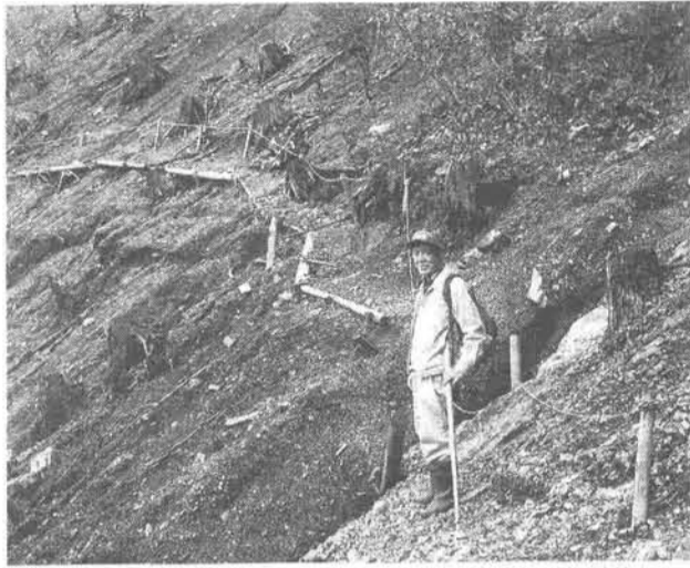
登山道は壊れ、地割りが広がる(川苔山ウスバ乗越)

東京の奥多摩で鹿の食害が原因で森林が砂漠のように砂礫化して奥多摩町の町営水道の水源が土砂に埋まった。