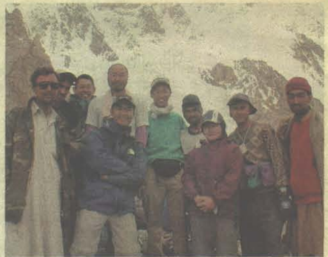
頑張った「どさん子同人K2登山隊」

第2回評議会を05年2月19日に開催 第26期第2回評議会を05年2月19日・20日に東京・晴海グランドホテルで開催。議題は、総括と方針討議、登山倍加運動。