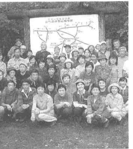
交流登山の参加者 (風吹大池)