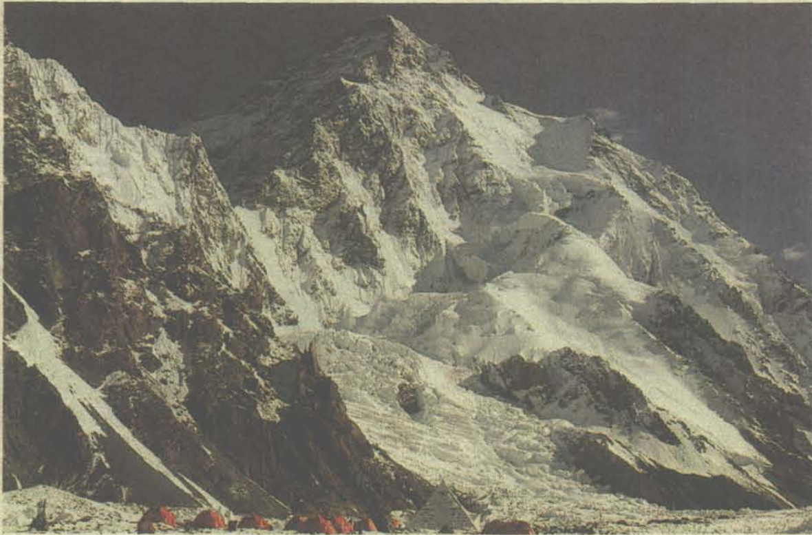
BCから見るそそり立つ世界第2の高峰「K2」(8611m)