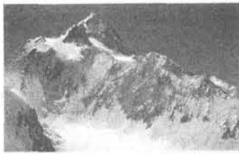
ガッシャーブルムI峰

ガッシャーブルムI峰(8068) 05登山隊員募集 期間 6月上旬~8月上旬 募集人数 5~10人 参加費 110万円(暫定額) 問合せ 全国連盟海外委員会 net.or.jp メール daga-mo@sasahi-net.or.jp 「みんなで止めた日高横断道路」『止めよう日高横断道路』全国連盟の活動の記録 日高山脈の自然を守ろうと道路建設を中止させた一八年の全活動の記録。 A4版200頁。発行・同連盟活動報告編集委員会。特別価格500円。連絡先・011(765)7775(今野平支店) 立ち枯れる世界遺産の森「大峰山脈立ち枯れ調査報告書」 大峰山脈での奈良県勤労者山岳連盟の5年間に渡る立ち枯れ調査の全記録。