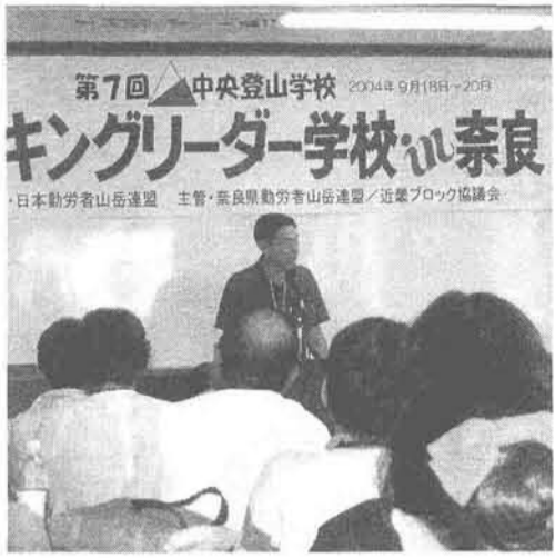
熱心に受講する参加者 (9月18〜19日)

奈良県連盟はこれまで、全国規模の取り組みの経験が無いため、主として近畿ブロックと協力して成功のた