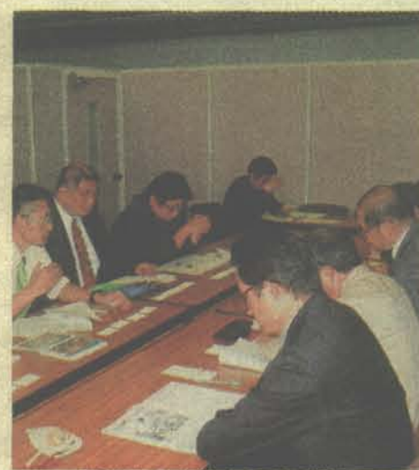
環境省と交渉する全国連盟

阿山・赤城山・白山・霧が降・木曾駒ヶ岳・大山の事業は完了。しかし情報は県への丸投げに近い不十分な事業だ。