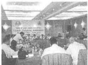
アジア山岳連盟10周年記念総会